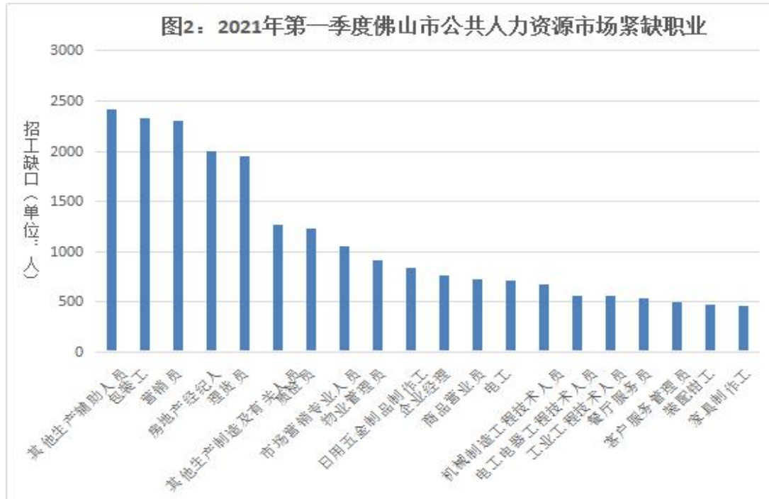
表11：需求大于求职缺口最大的前二十个职业（职业细类）